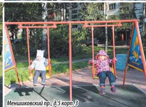
Меншиковский пр., д. 5 корп. 3