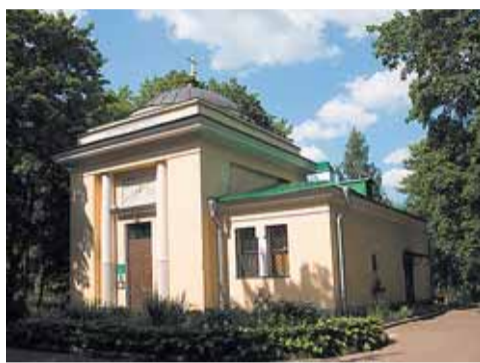
Церковь св. равноапостольной княгини Ольги при Дорожной клинической больнице.

Архитектурный облик часовни претерпел значительные изменения по сравнению с первоначальным замыслом. В проекте 1910 года это симметричное здание с шатровой кровлей и удлиненной главкой. Однако в итоге церковь была выполнена в неоклассическом стиле. Планировка стала ассиметричной.