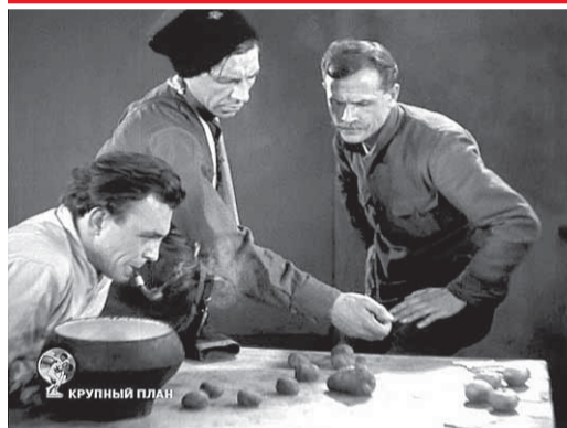
Ставший классическим эпизод с картошкой, при помощи которой комдив наглядно объясняет замполиту роль и место командира на поле боя.

НАГРАДЫ Картина Чапаев удостоена многих призов и премий: «Лучший фильм на иностранном языке» по версии Национального совета кинокритиков США (National Board of Review) в 1935 году, Гран-при Всемирной Парижской выставки в 1937 году, бронзовая медаль на кинофестивале в Венеции в 1946 году и другие. В 1941 году создатели фильма – режиссеры Георгий Васильев и Сергей Васильев, исполнитель главной роли Борис Бабочкин – стали лауреатами Сталинской премии I степени. В 1978 году по результатам опроса ведущих кинокритиков и искусствоведов лента «Чапаев» вошла в сотню лучших фильмов за всю историю мирового кинематографа.