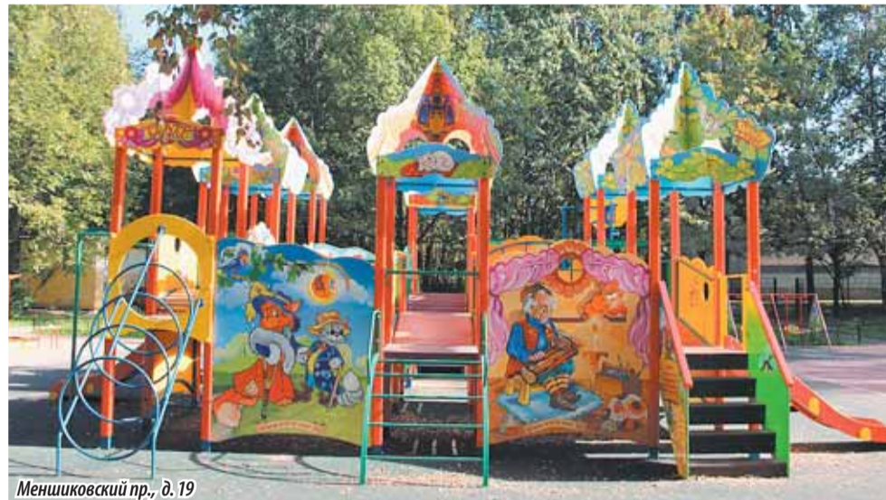
Меншиковский пр., д. 19

первых игр и гармоничного развития. Восторг у малышек вызывают обучающие элементы, смонтированные в мини-горку, так называемые буквы-цифры на вращающихся кубиках.