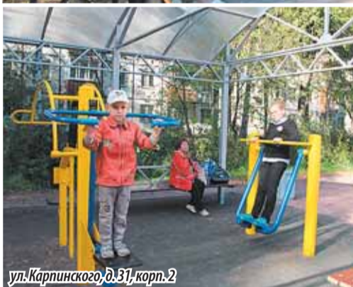
ул. Карпинского, д. 31, корп. 2