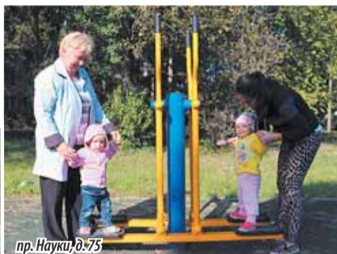
пр. Науки, д. 75