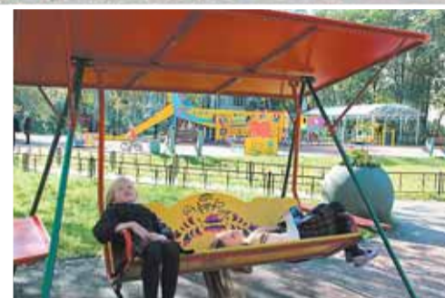
Карпинского, д. 31, корп. 2/3

Идей по благоустройству территории в МО Пискаревка очень много. И через некоторое время у нас обязательно появятся дворы образцового содержания.