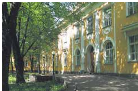
Узловая больница Северо-Западных железных дорог, главное здание

Одновременно с возведением больницы на данной территории было решено построить так называемый инвалидный дом им. Александра II, предназначенный для реабилитационных мероприятий. Он имел и другое название – Цандеровский институт, по имени шведского ученого Цандера, разработавшего систему механотерапии. На первом этаже размещался огромный зал, в котором находились первые механотерапевтические установки, способствовавшие лечению всевозможных травм и поврежде-