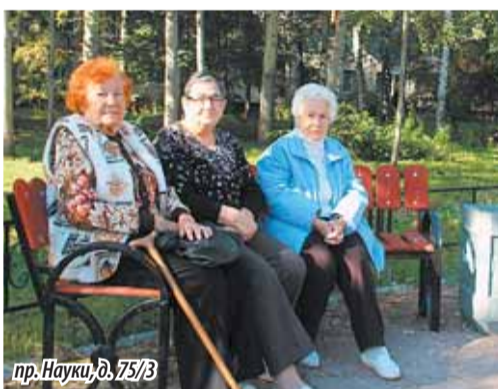
пр. Науки, д. 75/3