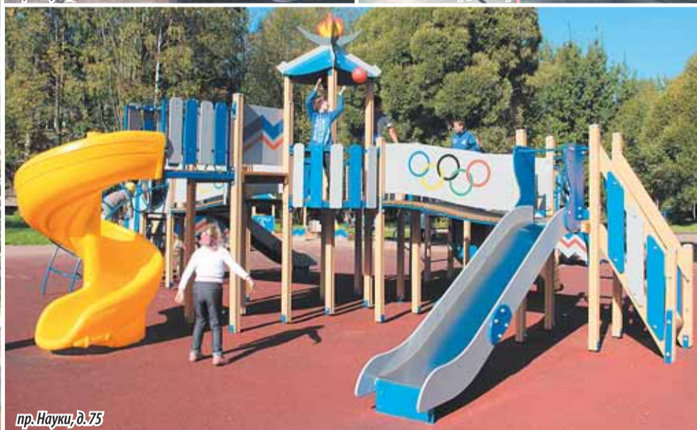
пр. Науки, д. 75